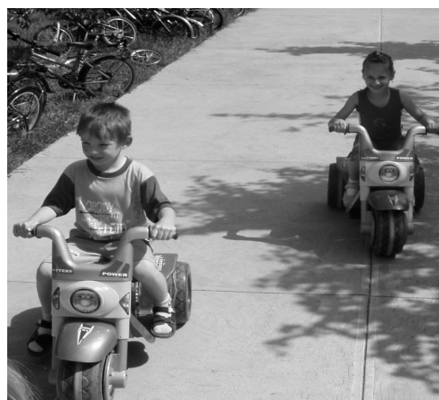
Nem sajnáltuk húzni a gázt!