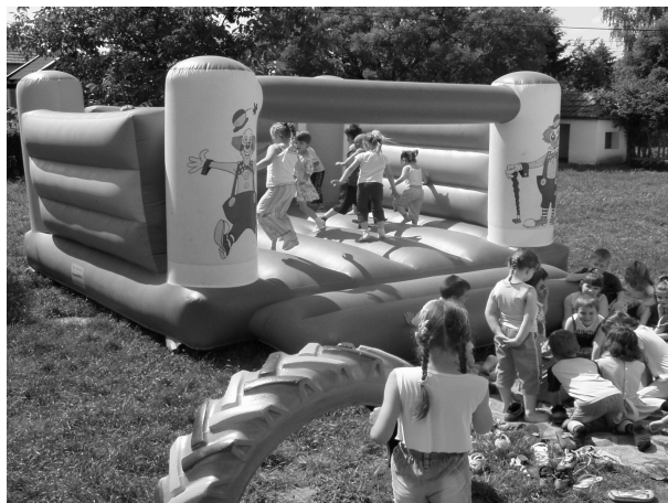
Egy kis testmozgás sosem árt!