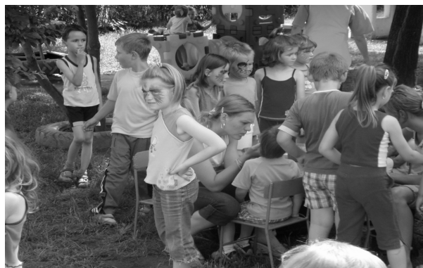
A színházban sem tudnák jobban...