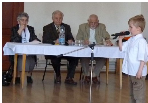
Pillanatkép a költészet napi versmondó versenyről