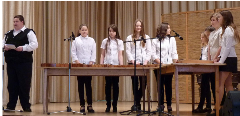
A Villő citerazenekar előadása