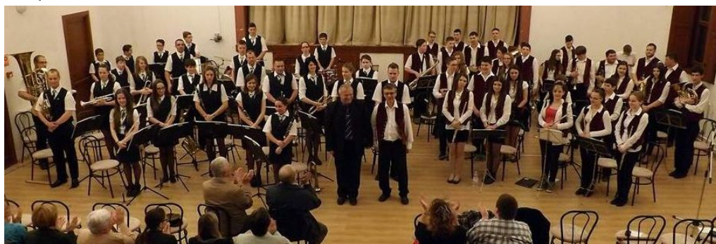
A Békési Ifjúsági és a Csorvási fúvószenekar közös koncertje