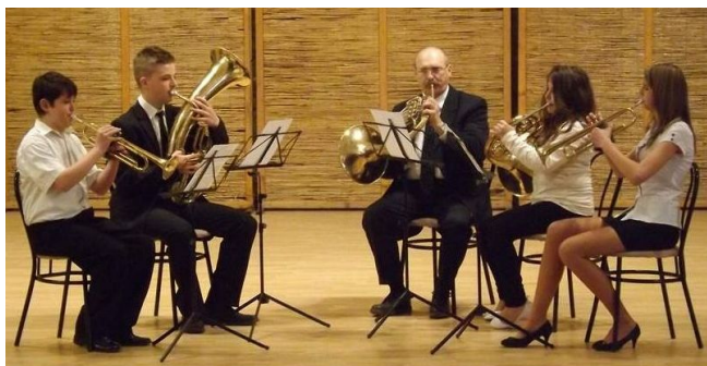
Az Alapfokú Művészeti Iskola fúvósai