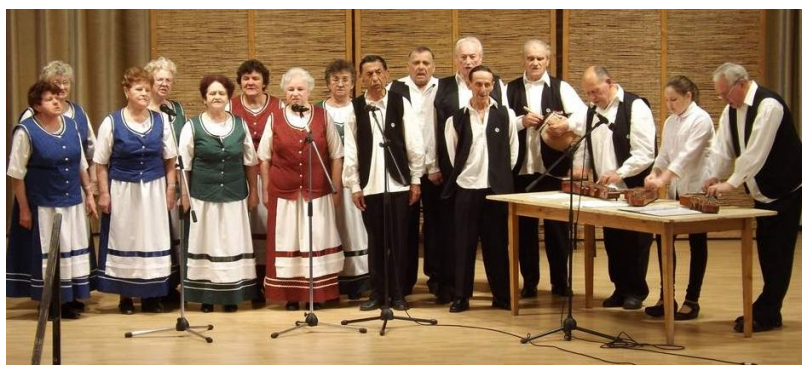
A Nefelejcs Népdalkör műsora