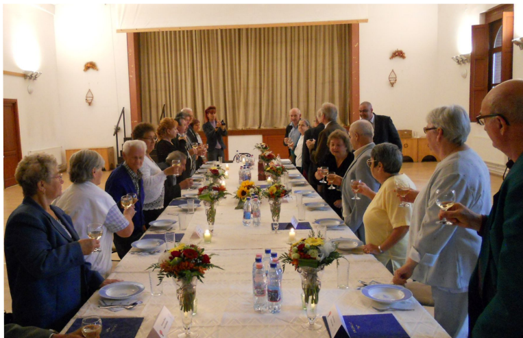
Fotó a jubiláló házaspárok 2015. évi önkormányzati köszöntéséről

Az ünnepi köszöntő után a pezsgős koccintás, és az önkormányzati emléklapok átadása következett.