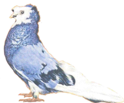
Szalontai óriás galamb