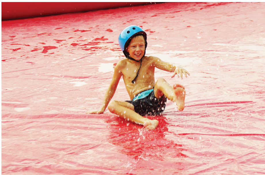
Kicsik, nagyok jól mulattak a sportnapon