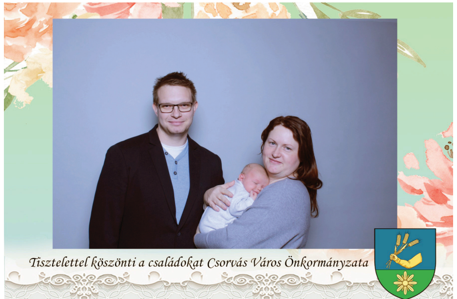
Tisztelettel köszönti a családokat Csorvás Város Önkormányzata

Ezután a város legifjabb lakosait, illetve szüleit, majd a 2018-ban házassá-