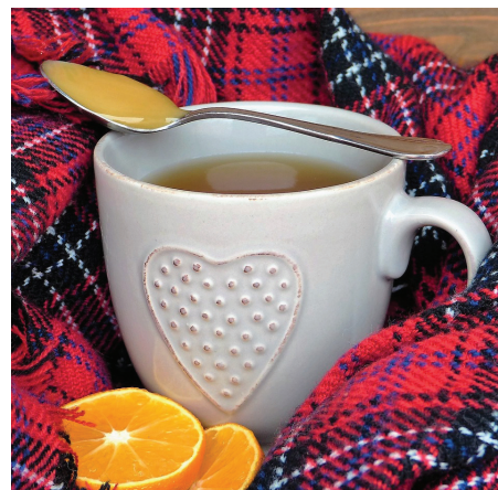
A forró tea, főként mézzel és citrommal segít a szervezetnek leküzdeni a betegséget

A legfontosabb, hogy aki influenzaszerű tüneteket észlel magán, maradjon otthon