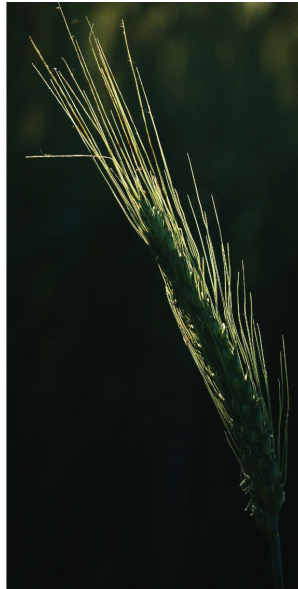
Nyár a csorvási határban