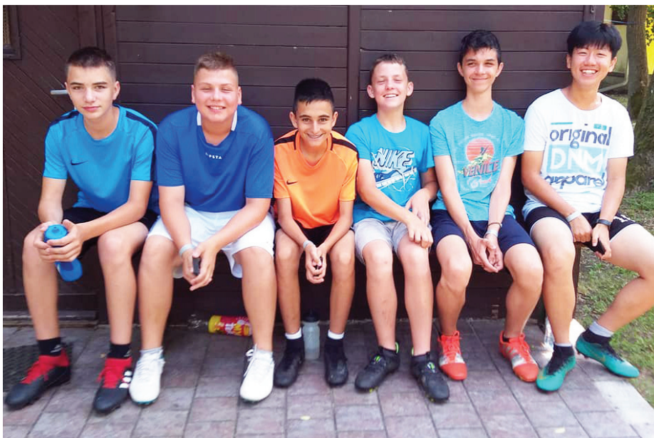
Pihenőt tart a csapat egy része

A közösségépítés terén pedig ismerkedtünk a város nevezetességeivel, minden nap strandoltunk, néhányan horgásztak és természetesen akadályversenyt is rendeztünk. Összegzőként elmondhatjuk, hogy az előző években